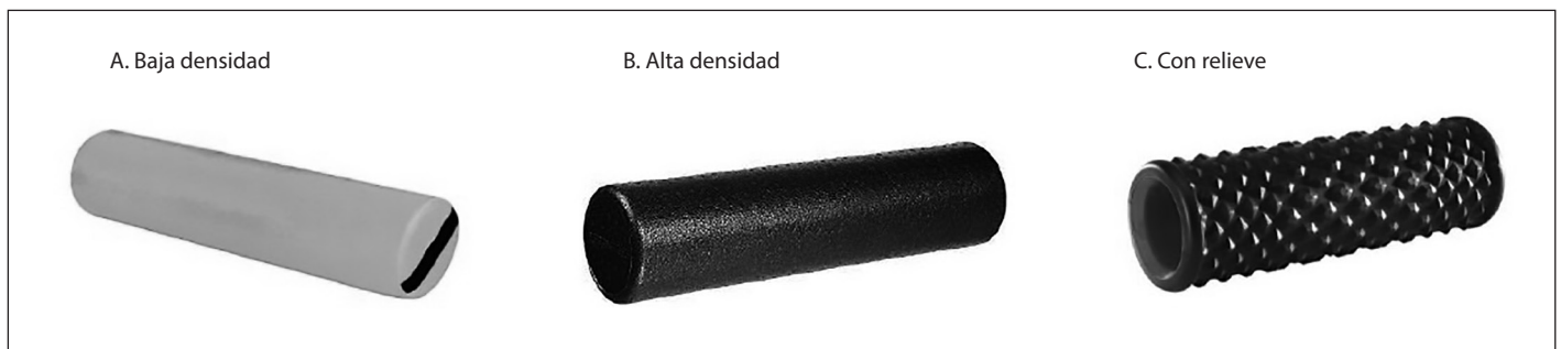
Figura 1. Roller foam o rodillo de espuma.